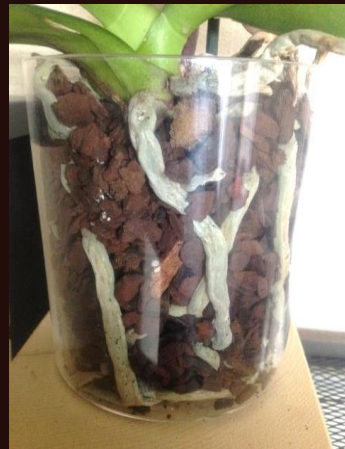
鉢の中が乾いてきた状態の写真。そろそろお水をあげるタイミングです。